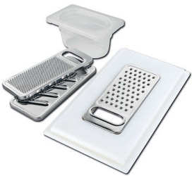
Kit râpes avec anneau de support et cuvette 8159 101

* uniquement en combinaison avec l'accessoire 8644 101