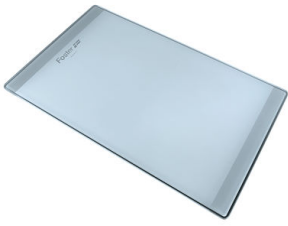
Planche de découpe en verre 8631 300