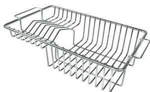
Panier à vaisselle inox 8100 201