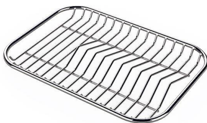
Grille porte-assiettes inox 8100 154